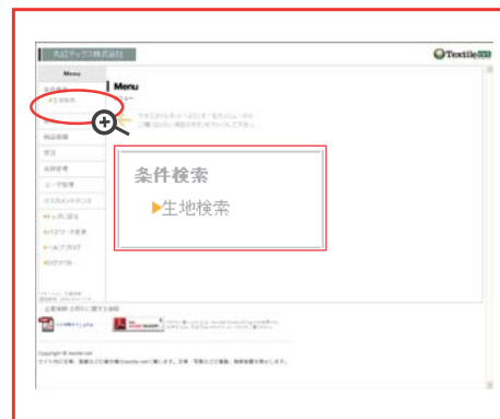
条件検索にポインタをあて、生地検索