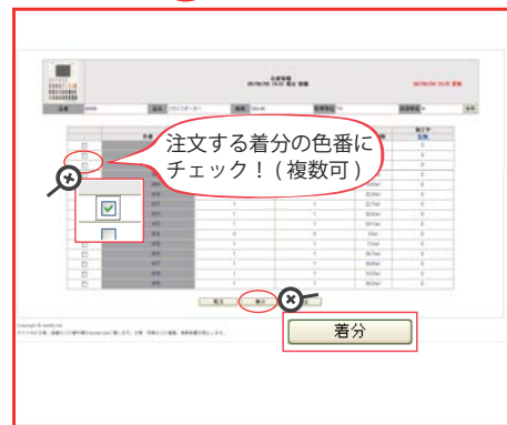
色番を確認しチェックを入れる→『着分』