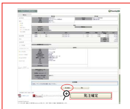
決済方法を確認し、『発注確定』