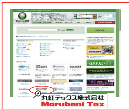
このバナーをクリック