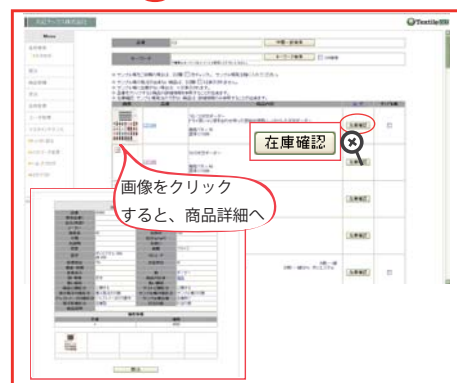
着分の発注には『在庫確認』