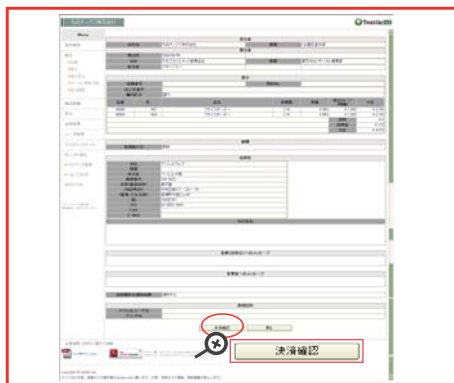
注文内容に間違いが無ければ『決済確認』