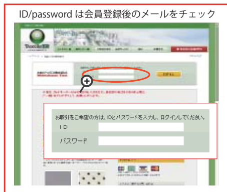
ID/PASSWORDを入力後、ログイン